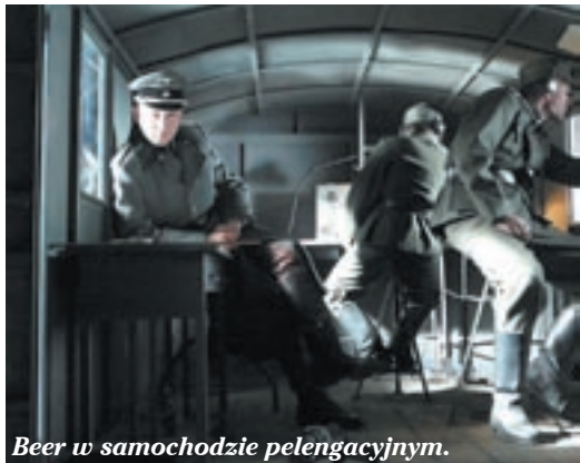
Beer w samochodzie pelengacyjnym.